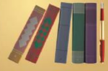
புத்தகங்கள் மற்றும் ஆசிரியர்கள்