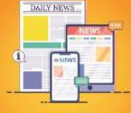
மாதத்தின் முக்கிய செய்திகள்