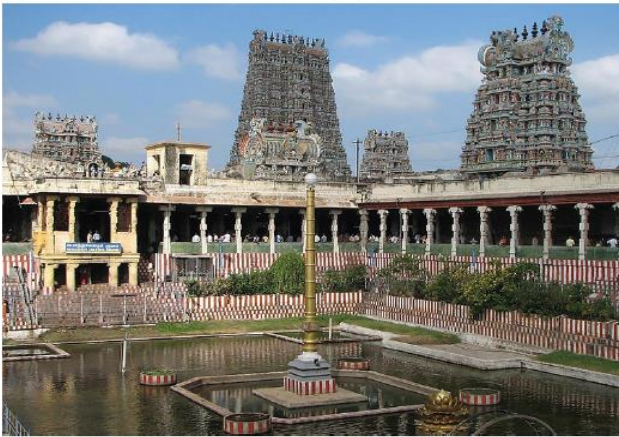
மதுரை மீனாட்சி அம்மன் கோவில்

இடைக்காலப் பாண்டியர்களும் பிற்காலப் பாண்டியர்களும் புதிய கோவில்கள் எதையும் நிர்மாணிக்கவில்லை. ஏற்கனவே இருந்த கோவில்களைப் பராமரித்தனர், புதிய கோபுரங்களையும் மண்டபங்களையும் கட்டிப் பெரிதாக்கினர். பெரி வடிவிலான அலங்கார வேலைப்பாடுகளுடன் கூடிய ஒற்றைக்கல் தூண்கள் இடைக்காலப் பாண்டியர்களின் தனித்தன்மை வாய்ந்த பாணியாகும். சிவன், விஷ்ணு, கொற்றவை, கணேசர், சுப்ரமணியர் ஆகிய தெய்வங்களின் சிற்பங்கள் இக்கோவில்களில் காணப்படும் சிறந்த கலை வடிவங்களாகும். வரலாற்றுச் சிறப்புமிக்க மதுரை மீனாட்சி அம்மன் கோவிலுக்குப் பாண்டியர் பேராதரவு நல்கினர். புதிய கோபுரங்களையும் மண்டபங்களையும் கட்டிக் கோவிலைத் தொடர்ந்து விசாலப்படுத்தினர்.