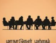
மாநாடுகள் மற்றும் உச்சி மாநாடுகள்