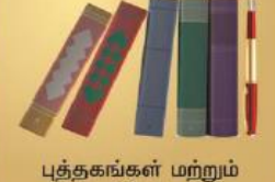
புத்தகங்கள் மற்றும் ஆசிரியர்கள்