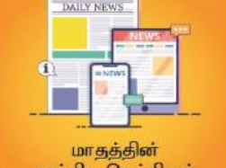
மாதத்தின் முக்கிய செய்திகள்