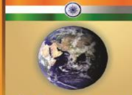
இந்தியா மற்றும் உலகம்