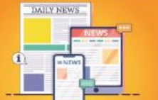
மாதத்தின் முக்கிய செய்திகள்