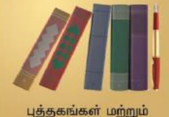
புத்தகங்கள் மற்றும் ஆசிரியர்கள்