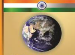
இந்தியா மற்றும் உலகம்