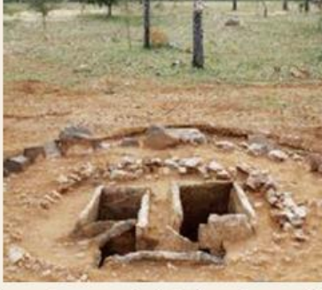
கொடுமணல் அகழாய்வில் தோண்டி எடுக்கப்பட்ட பெருங்கற்காலக் கல்லறை