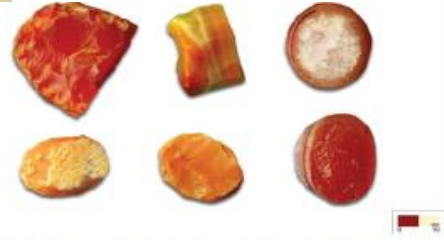
செதுக்கு மணிகள் செய்வதற்கான செம்மணிக்கற்கள்