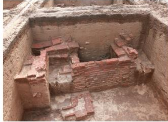
செங்கல் தொட்டி, கீழடி