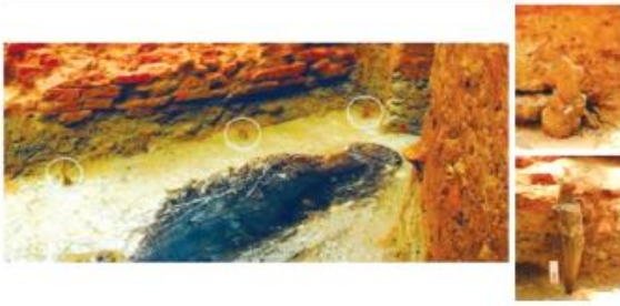
ஒரே மரத்தாலான படகின் பகுதி, பட்டணம்