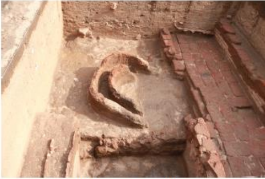
உருக்கு உலை, கீழடி