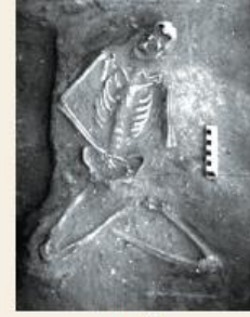
மனித எலும்புக்கூடு, கொடுமணல்