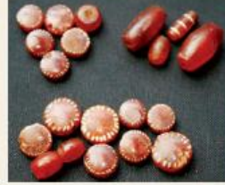
செம்மணிக்கல்லால் செய்யப்பட்ட மணிகள், கொடுமணல்