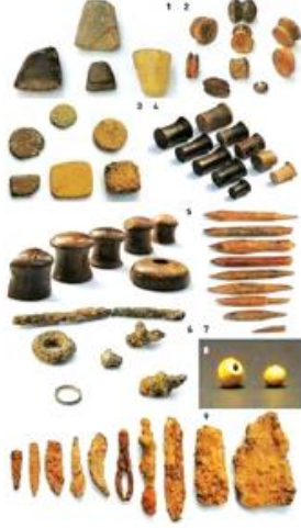
கீழடியில் கிடைத்த பலவிதமான பொருள்களும் அணிகலன்களும்