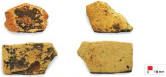
மேற்காசியப் பாளை ஓடுகள்