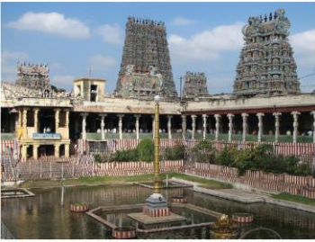
மதுரை மீனாட்சி அம்மன் கோவில்

இடைக்காலப் பாண்டியர்களும் பிற்காலப் பாண்டியர்களும் புதிய கோவில்கள் எதையும் நிர்மாணிக்கவில்லை. ஏற்கனவே இருந்த கோவில்களைப் பராமரித்தனர், புதிய கோபுரங்களையும் மண்டபங்களையும் கட்டிப் பெரிதாக்கினர். பெரி வடிவிலான அலங்கார வேலைப்பாடுகளுடன் கூடிய ஒற்றைக்கல் தூண்கள் இடைக்காலப் பாண்டியர்களின் தனித்தன்மை வாய்ந்த பாணியாகும். சிவன், விஷ்ணு, கொற்றவை, கணேசர், சுப்ரமணியர் ஆகிய தெய்வங்களின் சிற்பங்கள் இக்கோவில்களில் காணப்படும் சிறந்த கலை வடிவங்களாகும். வரலாற்றுச் சிறப்புமிக்க மதுரை மீனாட்சி அம்மன் கோவிலுக்குப் பாண்டியர் பேராதரவு நல்கினர். புதிய கோபுரங்களையும் மண்டபங்களையும் கட்டிக் கோவிலைத் தொடர்ந்து விசாலப்படுத்தினர்.