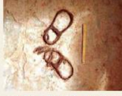
குதிரைச் சேணத்தில் பயன்படும் இரும்பு வளையங்கள், கொடுமணல்