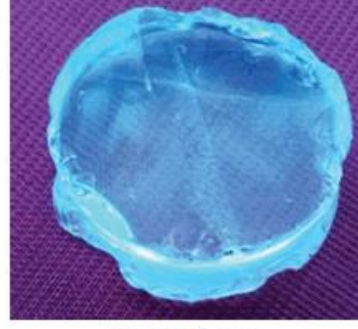
படிகத்திலான காதணிகள், கீழடி