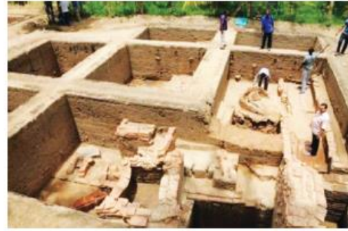
செங்கல் கட்டுமானங்கள், கீழடி