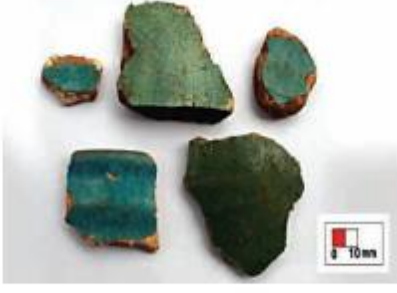
பச்சை கலந்த நீலவண்ண ஆடிப்பூச்சு உள்ள மேற்காசியப் பாளை ஓடுகள்