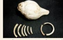
சங்கு வளையங்களின் உடைந்த பகுதிகள், சங்கு, கொடுமணல்