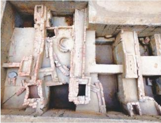
செங்கல் கட்டுமானங்கள், கீழடி