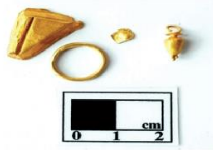
தங்க அணிகலன்கள், பட்டணம்