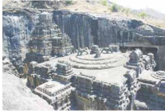
கைலாசநாதர் கோயில், எல்லோரா

ராஷ்டிரகூடர்கள் இந்தியச் சிற்பக் கலைக்கு வியத்தகு பங்களிப்பைச் செய்துள்ளனர். தற்கால மாஹாராஷ்டிராவில் அமைந்துள்ள எல்லோரா, எலி.பண்டா குடைவரைக் கோயில்கள் அவர்களது ஆட்சிக் காலத்தில் உருவானவையாகும். எல்லோரா குடைவரைக் கோவில் வளாகம் பௌத்த, சமண, இந்து மதச் சின்னங்களுக்கான கலை நுட்பத்தைக் கொண்டுள்ளது. முதலாம் அமோகவர்ஷர் சமண மதத்தை ஆதரித்தார். அவரது காலத்தியது எனக் கூறப்படும் ஐந்து சமண குகைக் கோயில்கள் எல்லோராவில் அமைந்துள்ளன.