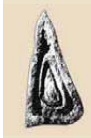
இதேபோன்ற கல்-சமகாலத்தைய வழிப்பாட்டுத்தலம்