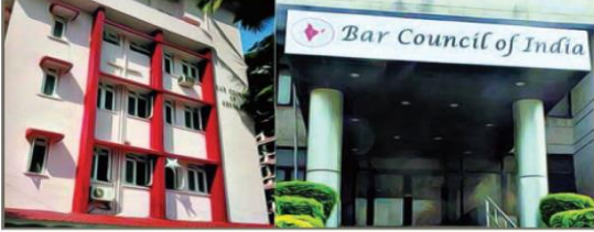
இந்திய வழக்குரைஞர் கழகம்