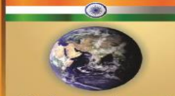
இந்தியா மற்றும் உலகம்