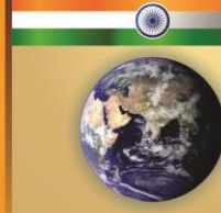
இந்தியா மற்றும் உலகம்