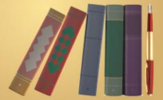
புத்தகங்கள் மற்றும் ஆசிரியர்கள்