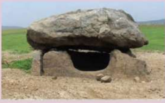
பாண்டவன் திட்டை, கருமபுரி