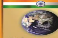
இந்தியா மற்றும் உலகம்