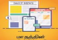
மாதத்தின் முக்கிய செய்திகள்