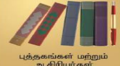
புத்தகங்கள் மற்றும் ஆசிரியர்கள்