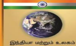
இந்தியா மற்றும் உலகம்