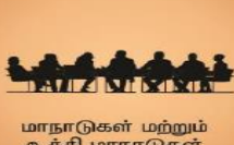
மாநாடுகள் மற்றும் உச்சி மாநாடுகள்