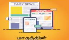
மாதத்தின் முக்கிய செய்திகள்