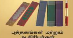
புத்தகங்கள் மற்றும் ஆசிரியர்கள்