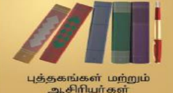
புத்தகங்கள் மற்றும் ஆசிரியர்கள்