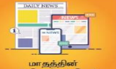
மாதத்தின் முக்கிய செய்திகள்